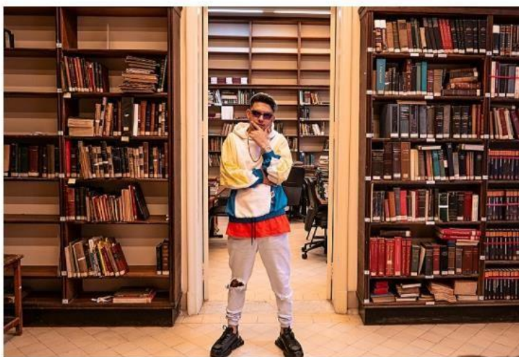
"É a vacina saliente que vai curar 'nois' do vírus e salvar muita gente", canta MC Fioti no clipe adaptado para o Instituto Butantan - Instituto Butantan

O clipe começa no mesmo estilo do original e MC Fioti faz dois pedidos ao gênio da lâmpada: a cura do coronavírus e "paz, amor e saúde para a humanidade". Na música, ele incentiva a vacinação ao dizer: "Autenticamente falando: Se vacina aí, pô".